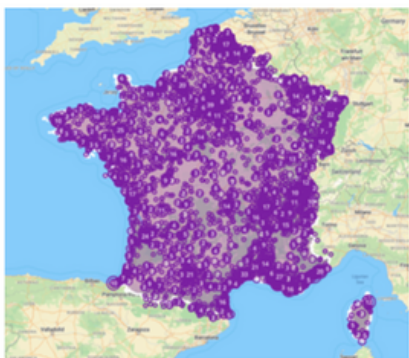
Carte des points de vente de burger

Sur la France entière, nous pouvons en effet compter 1 point de vente spécialisé dans le burger pour 4 847 habitants alors que nous comptons en moyenne 1 point de vente de sushis pour cette fois 9 559 habitants. Quasiment du simple au double, les burgers sont ainsi les grands vainqueurs de ce duel ! Cependant en regardant ville par ville, il y a tout de même de grandes disparités entre l'Île de France, les grandes métropoles et le reste du territoire.